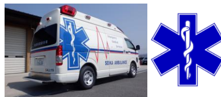
救急車のスター・オブ・ライフ

改めまして、あけましておめでとうございます。早速ですが、この度は巳年にちなんで、蛇を用いたシンボルマークについてご紹介いたします。蛇は古来より様々な神話や昔話に登場しますが、現代の実生活の中にも、蛇をモチーフにしたマークがいくつか使用されています。身近なところでは、WHO（世界保健機関）のシンボルマークや、救急車に付されたマーク（スター・オブ・ライフ ※すべての車両に付されている訳ではありません）などをよく見かけます。これらのマークに共通して使われているのは、蛇と杖のモチーフが元となっており、特に医療に関連した現場では見かけることが多く、幅広く応用されています。これは、ギリシャ神話に登場する天の星・蛇遣い座の守護神で医学の神と言われる“アスクレピオス”が、いつも蛇が巻きついた杖を持っていたことから、その杖が医学の象徴となり、国際的に共通のものになったことに由来します。ではなぜ蛇なのかというと、アスクレピオスが患者を診察している時に彼を驚かせた蛇を杖で殺してしまいましたが、他の蛇が、死んだ蛇の口に魔法の薬草を入れてよみがえらせたという神話にもとづくそうです。